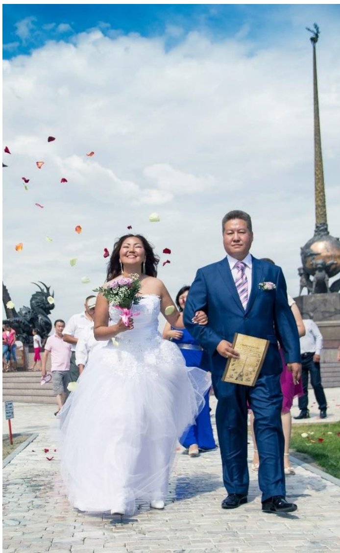
Виктория, Маңнай Хомушулар

“Өг-бүлө тудары дээргетөнчү чок удур-дедир кижизидилге-дир”(Ари-Фредерик Амьель)