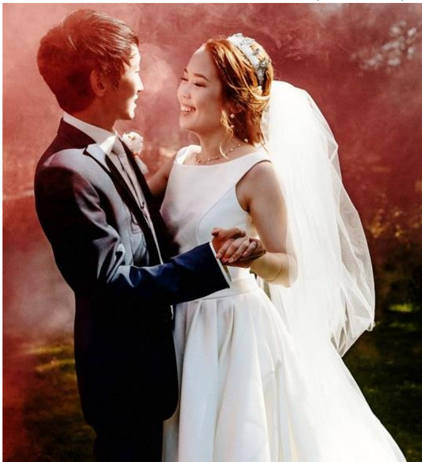
Энжин Монгуштун тыртырган чуруу

«Чурттулгада эң-не кол чүүл – өг-бүлө! Баштай төрүттүнүп келген өг-бүлөң, ооң соонда бодуңуң тудуп алган өг-бүлөң». (Джонни Депп)