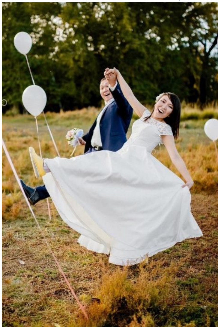
Энжин Монгуштуң тыртырган чуруу

«Аас-кежиктиг өг-бүлө дээрге уран чүүл-дүр. Ам артында ийи таладан». (Лев Толстой)